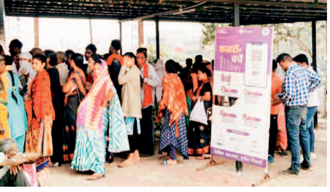
सुपेला सरकारी अस्पताल में इन दिनों बढ़ गई है मरीजों की संख्या।